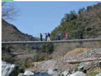
▲川の増水対策で横から支えている。地元の子もたちが命名。