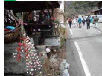
▲キレイな水が道脇のあちらこちらで湧いている。