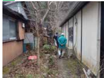
▲民家の中の狭い道だが、昔から使われている生活道路。