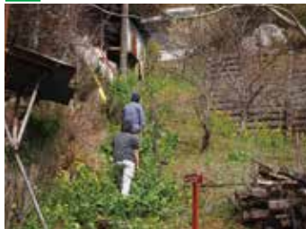
▲側溝に蓋がしてある。ちょっと急なので注意。迂回路もある。