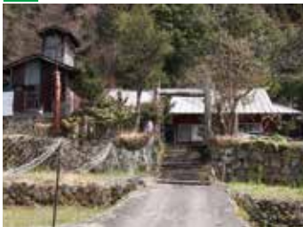
▲母屋は川に沿って横に長く、入口には門がある。祭の出発点。