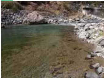
▲とにかく水が透き通っている。▲側溝に蓋がしてある。ちょっと平家マスの大物が潜む。