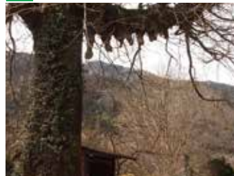
▲見事な乳根(気根)を持つ事から子宝の樹として親しまれている。